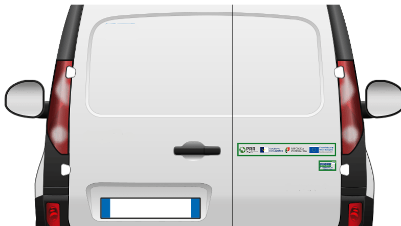
Exemplo de forma de aplicação

Sugere-se que após a escolha do veículo se proceda à realização de uma maquete, como abaixo exemplificada, e que se envie a mesma para validação da Recuperar Portugal (inf@recuperarportugal.gov.pt).