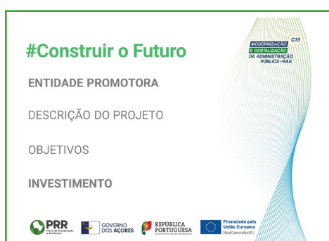
Exemplo de painel/cartaz horizontal

Após o início de operacionalização do edifício, o roll-up da C19-i06-RAA deverá estar colocado na sua entrada.