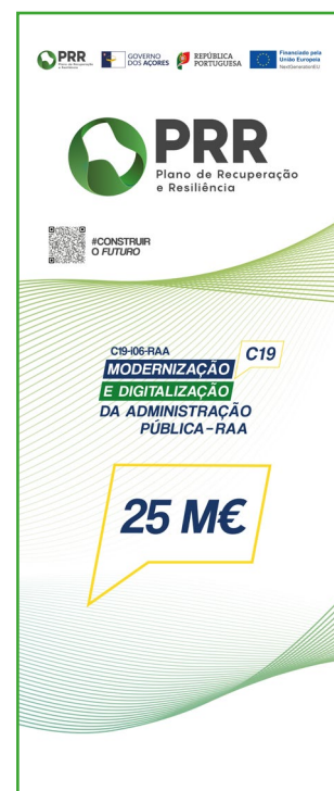
Imagem para o roll-up